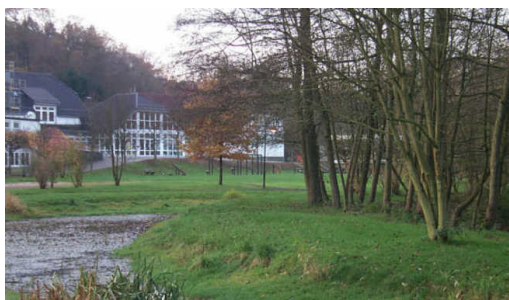
Grundschule Schönenberg am Brölbach