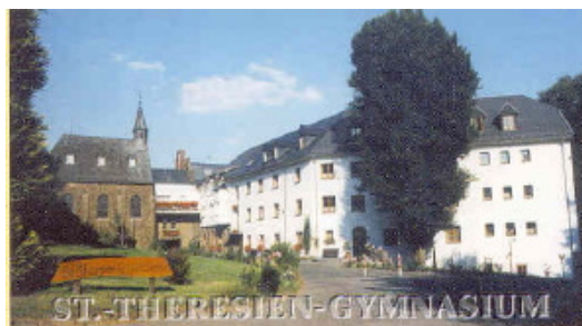
Sankt-Theresien-Gymnasium in Schönenberg