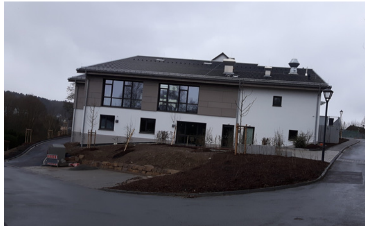
Sekundarschule Nümbrecht/Ruppichteroth – Standort Ruppichteroth –